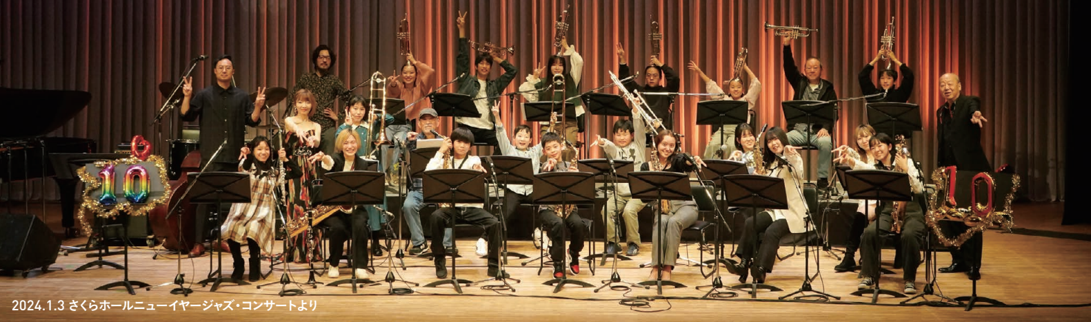
2024.1.3 さくらホールニューイヤージャズ・コンサートより

本公演は二部構成、一部はジャズ・ピアニストとして国内外で活躍する山中千尋さん率いるピアノ・トリオ、二部は坂本龍一さんの楽曲を、大和田レインボウ・プロジェクトのメンバーで編成されるビッグ・バンドと山中千尋トリオの共演でお楽しみいただけます。