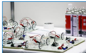
水素で動くモデルカー

環境にやさしい水素エネルギーや燃料自動車のしくみを知って、水素で動くモデルカーを走らせてみましょう。ぜひ親子でご参加ください。◆協力：本田技研工業株式会社