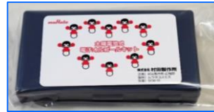
(みほん：電子オルゴール)