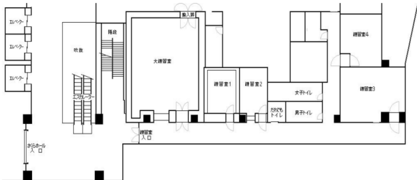
渋谷区文化総合センター大和田 4階