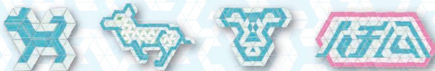
T3 パズルをつかってえがいたハチ公のデザイン